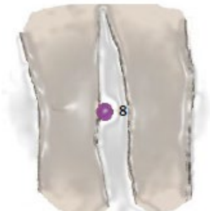
8. KP Kniepunkt